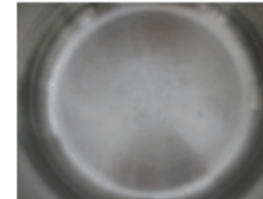
Mrlje nakon čišćenja