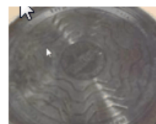
Promjena boje dna sa vanjske strane